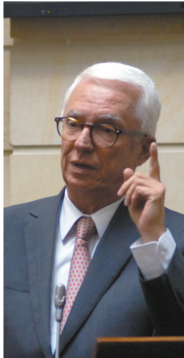
El senador Robledo es conocido por sus debates de contral político entre los cuales se destacan: REFICAR, ISAGEN, ODEBRECHT, Agro Ingreso Seguro, SaludCoop, entre muchos más.

Fue un descaró de su parte porque las andanzas de Carrasquilla ya se conocían. Seguramente calculó que todo el mundo se iba a tragar el sapo. No contó con que somos muchos los colombianos que no toleramos estas vagabunderías. Y demostró que era demagogia su frase de campaña “el que la hace la paga”. Porque Carrasquilla la hizo y no la pagó. Peor aún: lo premió y lo sigue premiando al mantenerlo en el cargo.